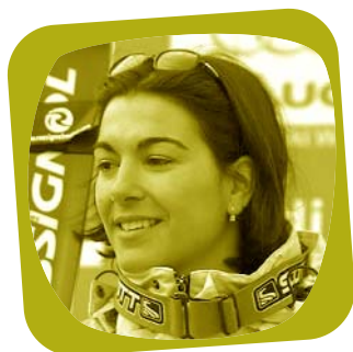
María José Rienda